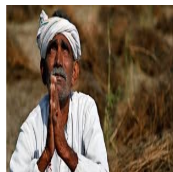
Ινδός αγρότης προσεύχεται να βρέξει

κύριους λόγους για το φαινόμενο την πτώχευση ή υπερχρέωση των αγροτών, τα προβλήματα που συνδέονται με την παραγωγή (μη απόδοση της σοδειάς, καταστροφή της παραγωγής λόγω φυσικών φαινομένων, αδυναμία πώλησης), την ακραία φτώχεια κ.ά.