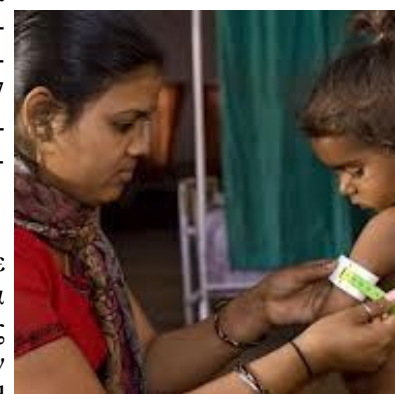
Μεγάλος αριθμός μη κανονικά ανεπτυγμένων παιδιών

2.ΚΛΙΜΑΤΙΚΗ ΑΛΛΑΓΗ: Το έτος 2015, 9 από τα 29 κρατίδια της Ινδίας αντιμετώπισαν συνθήκες ξηρασίας και ζήτησαν οικονομική βοήθεια ύψους 200 δις ρουπιών (€2,8 δις) από την κεντρική κυβέρνηση. Από την άλλη πλευρά, ενισχύθηκαν τα φαινόμενα έντονων βροχοπτώσεων στην Κεντρική Ινδία, ενώ εξασθένησαν οι μέτριες έντασης βροχοπτώσεις. Συνολικά, μόνο το 2014-15 και εξαιτίας των φαινομένων που συνδέονται με την κλιματική αλλαγή, χάθηκαν 92.180 ζώα που χρησιμοποιούνται στον γεωργικό τομέα, καταστράφηκαν 725.390 σπίτια και επλήγησαν 2,7 εκ. εκτάρια καλλιεργήσιμης γης. Σύμφωνα με έρευνα του Indian Council of Agricultural Research, είναι πιθανό, έως το 2020, να μειωθεί η παραγωγή των σημαντικότερων καλλιεργειών κατά 18%.