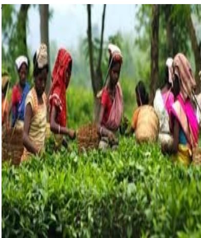
Φυτεία τσαγιού στη Νότιο Ινδία

«Με τη συμμετοχή της Ινδίας στην TPP, η παραγωγή γενοσήμων φαρμάκων θα επλήγεται σοβαρά»