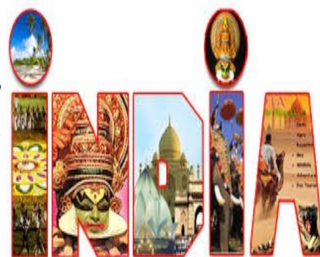
Κρατική διαφήμιση για τον ινδικό τουρισμό

τουρισμού, γεγονός που σημαίνει ότι η κρίση εντοπίζεται στο υπόλοιπο κομμάτι του τομέα. Τονίζουν, δε, ότι η Ινδία έχει μεγάλο ανταγωνισμό από τις γειτονικές σε αυτή χώρας, που επίσης αποτελούν εξωτικούς προορισμούς για Ευρωπαίους και Αμερικανούς, αλλά δεν κατάφερε να κάνει τα κατάλληλα βήματα που αυτές έχουν κάνει για την αύξηση του