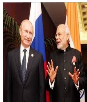
Ο Ινδός Πρωθυπουργός Narendra Modi με τον Ρώσο Πρόεδρο Vladimir Putin στην πρόσφατη επίσκεψη του πρώτου στη Μόσχα

7. Μνημόνιο Κατανόησης μεταξύ GLONASS και Centre for Development of Advance Computing για συνεργασία σε εμπορικές εφαρμογές μέσω ενσωμάτωσης ρωσικών και ινδικών συστημάτων δορυφορικής πλοήγησης.