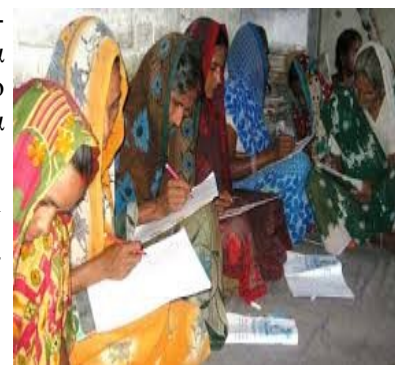
Πρόγραμμα διδασκαλίας γραφής σε αγρο-

4.ΑΝΑΦΑΛΒΗΤΙΣΜΟΣ: 282 εκ. Ινδοί είναι αναλφάβητοι, αριθμός μεγαλύτερος από τον συνολικό πληθυσμό της Ινδονησίας. Ο Προϋπολογισμός έτους 2015-16 μείωσε τόσο τις δαπάνες για την Παιδεία (-16%), όσο και αυτές για την ανάπτυξη των ανθρώπινων πόρων (-4,6%). Οι δημόσιες δαπάνες για την εκπαίδευση ανήλθαν το 2013 κατά μέσο όρο παγκοσμίως σε 4,9%, σε σύγκριση με 3,3% στην Ινδία, σύμφωνα με στοιχεία της Παγκόσμιας Τράπεζας. Σχεδόν το 18% των μαθητών δεν συμπληρώνουν τη δευτεροβάθμια εκπαίδευση, ενώ σε εξετάσεις αξιολόγησης μέσα στο έτος 2015, το 99% των δασκάλων πρωτοβάθμιας εκπαίδευσης στο κρατίδιο Maharashtra απέτυχε, παρά το γεγονός ότι δαπανήθηκε ποσό $94 δις την τελευταία δεκαετία για την εκπαίδευσή τους.