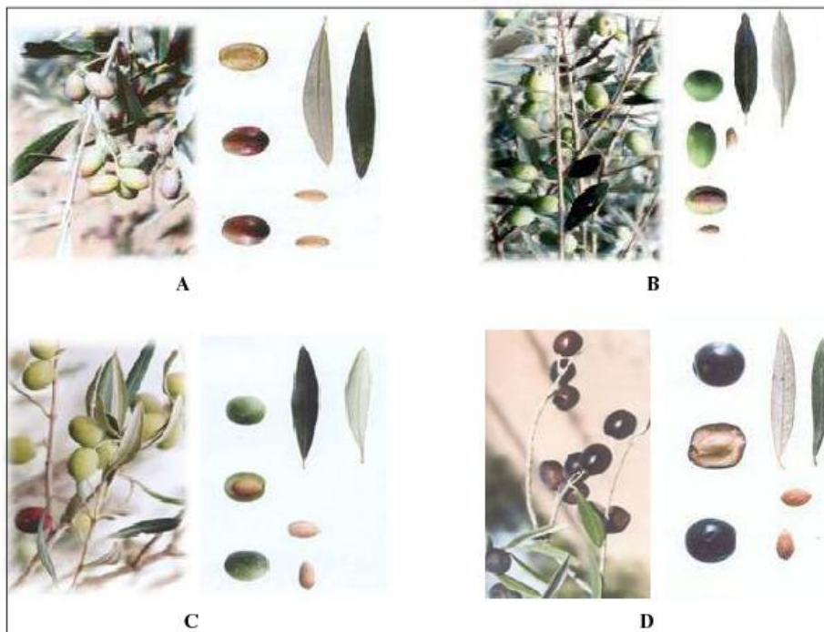
Οι βασικότερες tunησιακές ποικιλίες ελιάς, A) Chemlali, B) Chétoui, C) Oueslati, D) Zarrazi

Οι αρμόδιες Αρχές λαμβάνουν μέτρα για τους κινδύνους που απειλούν την ελαιοπαραγωγή κυρίως σε ότι αφορά την πρόληψη των ασθενειών και της απειλής της ελαιοπαραγωγής από το καταστροφικό βακτήριο " Xylella fastidiosa " που μαστίζει την Ιταλία και απειλεί τους ελαιώνες της Μεσογείου. Όσον αφορά την πρόοδο μιας εν εξελίξει εθνικής εκστρατείας για την καταπολέμηση των παρασιτικών ασθενειών, σύμφωνα με τα στοιχεία των Αρχών, προγραμματίζεται κάθε χρόνο σχέδιο φυτουγειονομικής προστασίας εκατομμυρίων ελαιόδεντρων.