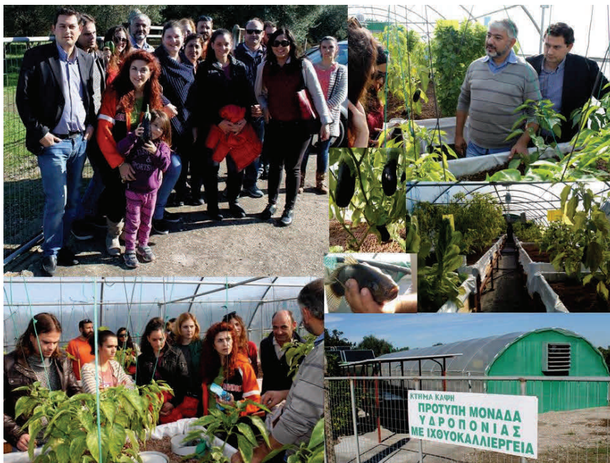
Στιγμιότυπα από την επίσκεψη στο Κτήμα Καφή.