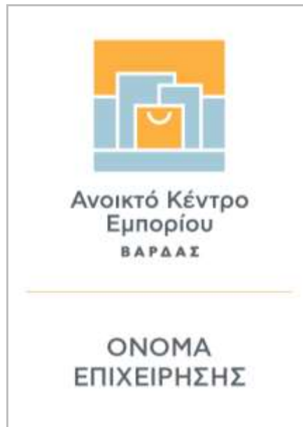
Εικόνα 2: Επιγραφή καταστήματος